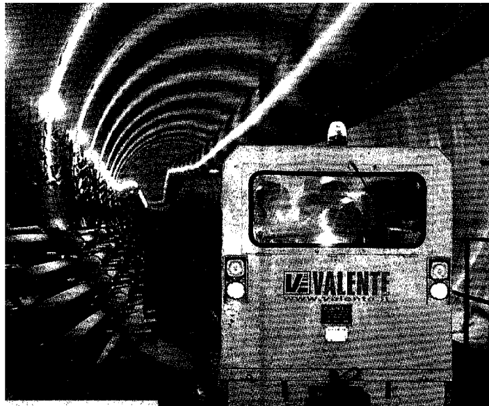
IL CANTIERE Il sindaco ieri ha visitato il cantiere della linea C