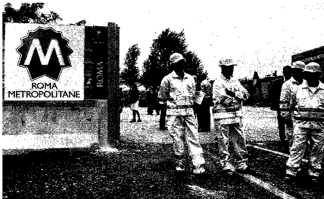
I corridoi del trasporto pubblico sono nuove componenti del sistema della mobilità indicate dal piano regolatore generale