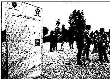
Inaugurati i lavori per i corridoi protetti all'Eur

Sul tracciato viaggeranno 43 filobus bimodali con trazione elettrica e motore diesel. Ci sono voluti 2 anni di lavori per velocizzare i mezzi pubblici lungo l'asse della Laurentina. E' l'obiettivo del "corridoio del trasporto pubblico Eur-Laurentina-Tor Pagnotta", i cui cantieri sono partiti ieri: i filobus da 18 metri che verranno utilizzati viaggeranno per lunghi tratti su corsie protette, evitando il traffico. Poi il percorso verrà prolungato fino a Trigoria e ne verrà realizzato un altro tra Eur Fermi e Mezzocammino-Tor de' Cenci. Il primo corridoio andrà dalla fermata Eur-Laurentina della metro B a Tor Pagnotta. Si tratta di 12,7 chilometri con corsie protette per i mezzi pubblici e la conclusione è prevista per dicembre 2011.